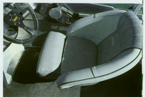
Die sehr bequemen vorderen Einzelstühle verfügen über nach oben klappbare Sitzflächen, so dass die Buster XL auch stehend manövriert werden kann. Ein absolut empfehlenswertes, weil komfortsteigerndes Extra sind die neuerdings lieferbaren Gasdruckdämpfer unter den Sitzen

größtmögliche Wirtschaftlichkeit. Im unteren Drehzahlbereich beeindruckt der metallischeblaue Viertakter mit der Laufkultur einer gut geölten Nähmaschine, beispielsweise notieren wir bei 1500 min -1 und 4,8 Knoten Schleichfahrttempo flüsterleise 61 dB(A). Bis etwa 3300 min -1 ist man im Verdrängerbereich unterwegs, danach tritt die Buster fast übergangslos in die Gleitphase ein. Glatte 25 Knoten bei 4500 Touren erweisen sich als ideale Cruising Speed für den sanften Ritt über die Wellen, zumal der Geräuschpegel mit 79 dB(A) angenehm niedrig bleibt und eine relativ gepflegte Konversation im Cockpit zulässt. Mit zunehmender Geschwindigkeit wird's zwar entsprechend lauter, an der ausgezeichneten Fahrstabilität des Bootes ändert sich aber nichts. Wie auf Schienen zieht die Buster in die engste Kurve. Bewusst herbeigeführte Extremma-