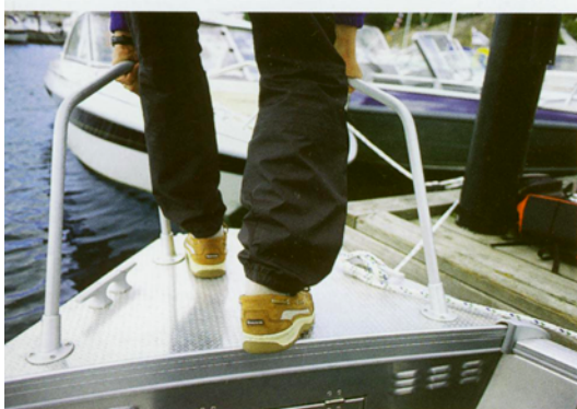
Das Ein- und Aussteigen über die strukturierte Trittpläche am Bug funktioniert prima, zumal man sich an den Relingbügeln festhalten kann