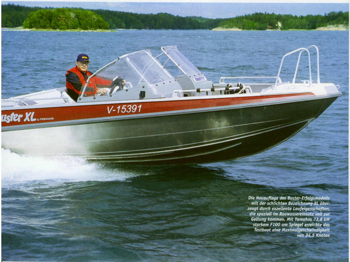
Die Neuauflage des Buster-Erfolgsmodells mit der schlichten Bezeichnung XL überzeugt durch exzellente Laufeigenschaften, die speziell im Rauwassereinsatz voll zur Geltung kommen. Mit Yamahas 73,6 kW starkem F100 am Spiegel erreichte das Testboot eine Maximalgeschwindigkeit von 34,5 Knoten

Laut Herstellerempfehlung ist die Buster XL für Außenborder bis 85 kW am Propeller ausgelegt. Unser mit drei Personen besetztes Testboot wird von einem Yamaha F100 AETL angetrieben, der 73,6 kW generiert und 164 kg auf die Waage bringt. Der japanische Reihenvierzylinder mit einem Hubraum von 1596 cm 3 verfügt über modernste 16-Ventil-Technik, zwei oberliegende Nockenwellen und ein optimal abgestimmtes Ansaug- und Abgassystem für