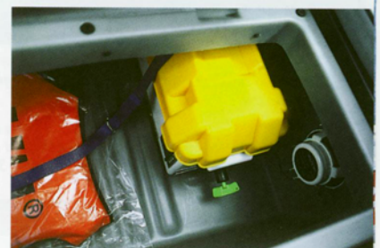
Unterhalb der Rückbank ist die Batterieanlage montiert. Ein Hauptschalter gehört zur Standardausstattung des Bootes

größtmögliche Wirtschaftlichkeit. Im unteren Drehzahlbereich beeindruckt der metallischeblaue Viertakter mit der Laufkultur einer gut geölten Nähmaschine, beispielsweise notieren wir bei 1500 min -1 und 4,8 Knoten Schleichfahrttempo flüsterleise 61 dB(A). Bis etwa 3300 min -1 ist man im Verdrängerbereich unterwegs, danach tritt die Buster fast übergangslos in die Gleitphase ein. Glatte 25 Knoten bei 4500 Touren erweisen sich als ideale Cruising Speed für den sanften Ritt über die Wellen, zumal der Geräuschpegel mit 79 dB(A) angenehm niedrig bleibt und eine relativ gepflegte Konversation im Cockpit zulässt. Mit zunehmender Geschwindigkeit wird's zwar entsprechend lauter, an der ausgezeichneten Fahrstabilität des Bootes ändert sich aber nichts. Wie auf Schienen zieht die Buster in die engste Kurve. Bewusst herbeigeführte Extremma-