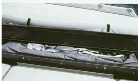
Wird staubgeschützt hinter der Fondbank aufbewahrt: Das optionale Cabrioverdeck, Kostenpunkt 1200 €, verschwindet bei Nichtgebrauch in einem eigens dafür vorgesehenen Behältnis