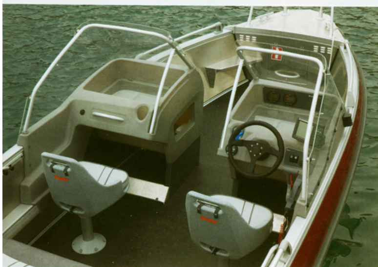
Das selbstlenzende Cockpit der Buster XL wartet mit 67 cm Freibord auf und bietet Platz für fünf bis sechs Personen. Besonders windgeschützt sitzt man hinter den 130 cm hohen Konsolen