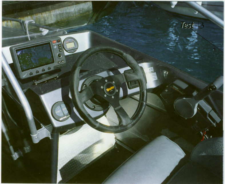
Die mechanische Lenkung arbeitet leichtgängig und ohne Spiel. Zwischen den Anschlagpunkten liegen etwas mehr als vier Ruderdrehungen